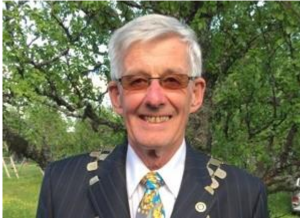
MINE OPPLEVELSER SOM MEDLEM AV ROTARYS VAKSINASJONSTEAM MOT POLIO I AGRA I INDIA.